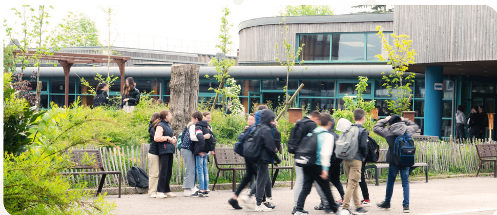
Ilot de verdure au collège de Rambervillers