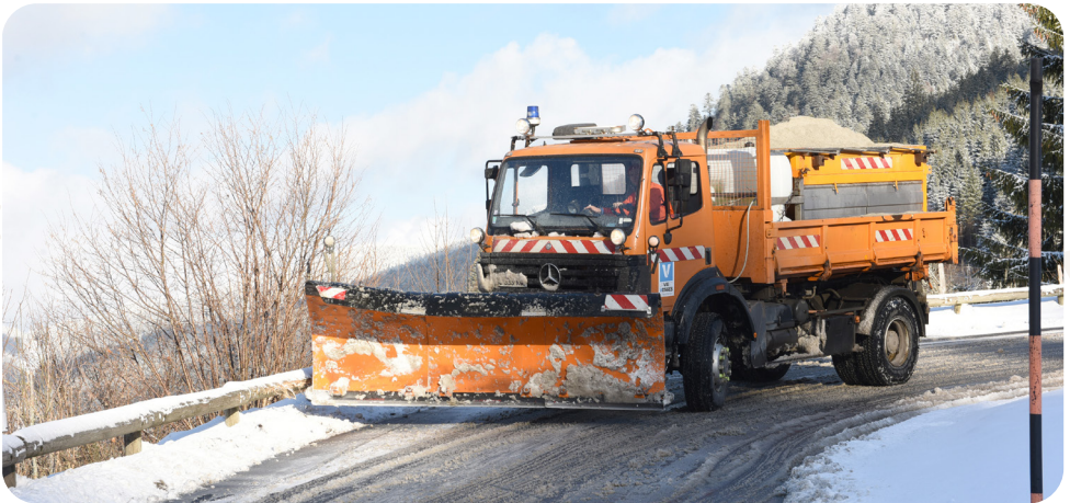
Déneigement des routes

De par ses compétences, le Département peut agir directement sur ses infrastructures en évitant l'arrivée de polluants dans le milieu naturel, mais il peut également aider les collectivités à en faire de même via ses services d'ingénierie.