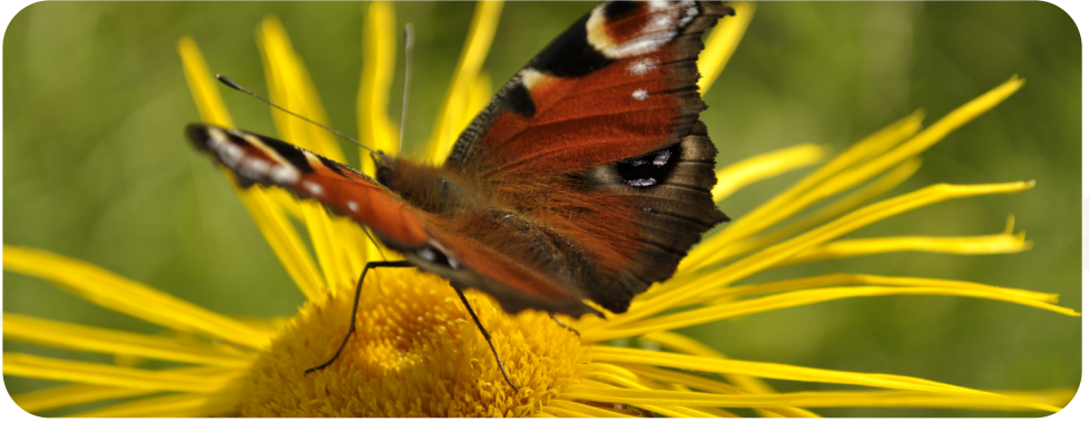
Paon du jour à Granges-Autmonzey