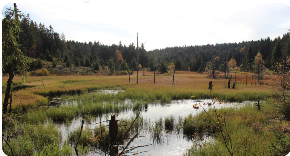
Tourbière de Jemnaufaing