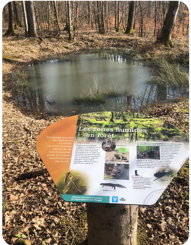
Mare ENS de Tignécourt